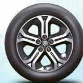
17-дюймовые легкосплавные диски