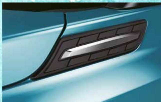
НАКЛАДКА ПЕРЕДНЕГО КРЫЛА