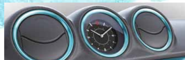
Окантовка дефлекторов кондиционера