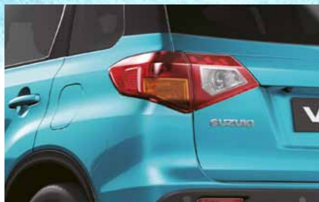
ВЫШТАМПОВКА НА ЗАДНЕМ КРЫЛЕ И ШИРОКИЕ ЗАДНИЕ СТОЙКИ