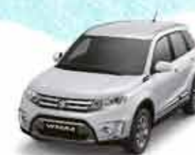
Cool White Pearl