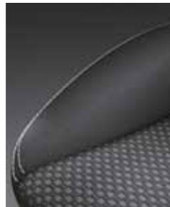
Тканевая обивка с контрастной прострочкой