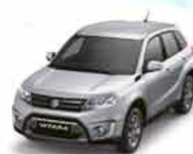
Silky Silver Metallic