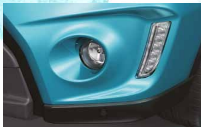
СВЕТОДИОДНЫЕ ДНЕВНЫЕ ХОДОВЫЕ ОГНИ