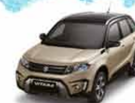
Savannah Ivory Metallic

Этот цвет вызывает воспоминания о просторах саванны, пробуждая дух искателя приключений.