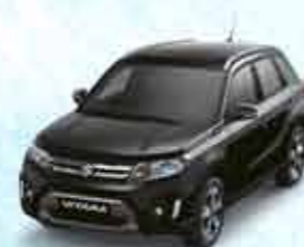
Cosmic Black Pearl Metallic

Этот цвет вызывает воспоминания о просторах саванны, пробуждая дух искателя приключений.