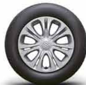
16-дюймовые стальные диски с цельными колёсными колпаками