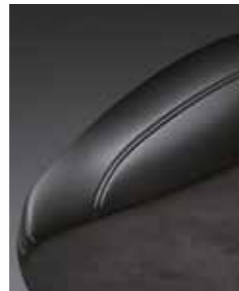
Комбинированная обивка сиденья (кожа + замша)