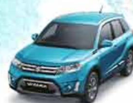
Atlantis Turquoise Pearl Metallic

Этот цвет вызывает волнение и трепет открытия естественной красоты в сверхурбанизированных населённых центрах.