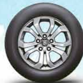
16-дюймовые легкосплавные диски