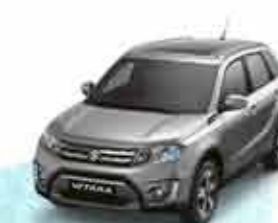
Galactic Grey Metallic