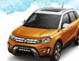
Horizon Orange Metallic

Этот цвет рождает приятное ожидание встречи с природой при выезде из шумного мегаполиса в живописные предместья.